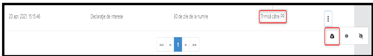
Figura 19 - Descărca document