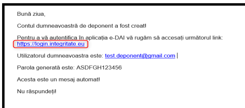
Figura 1 - Credentiale deponent

Fiecare utilizator cu rol de deponent va fi înregistrat în sistem de către persoana responsabilă din cadrul instituției din care face parte. Ulterior, acesta va primi un e-mail care va conține numele utilizatorului, parola și link-ul de acces în aplicație.